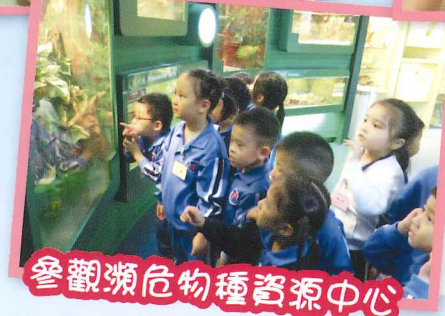
參觀瀕危物種資源中心