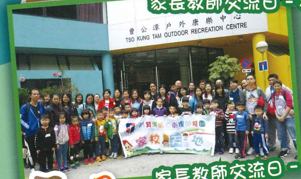
家長教師交流日 - 戶外活動