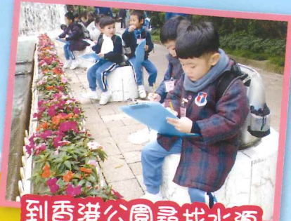
到香港公園尋找水源