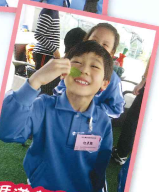
參觀循道衛理中心農圃