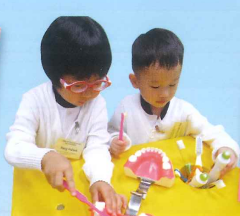
參觀陽光笑容小樂園