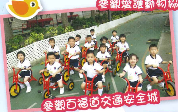
參觀百福道交通安全城