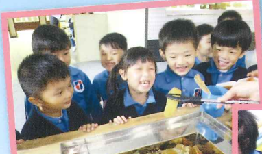
參觀稻鄉飲食文化博物館