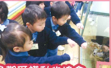
參觀愛護動物協會