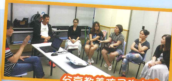
分享教養孩子的方法