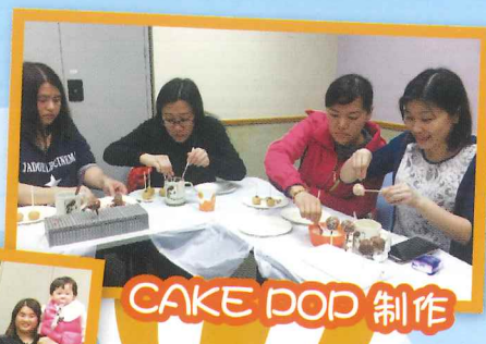
CAKE POP 制作