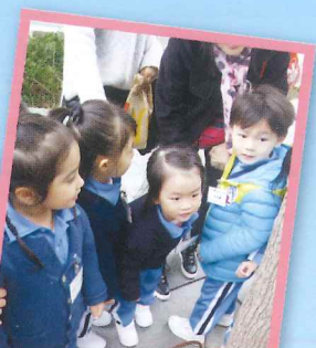
參觀愛珠序灣公園