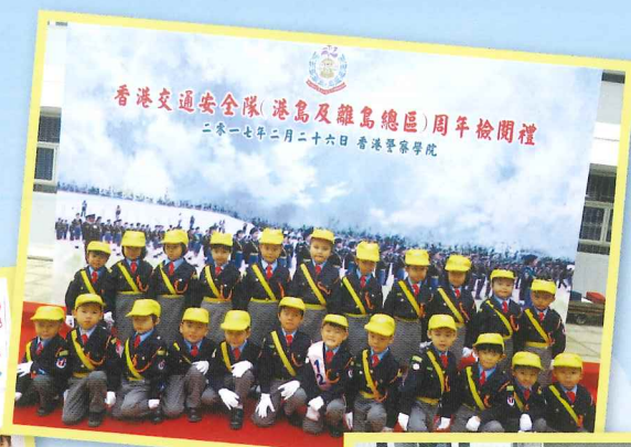
香港交通安全隊(港島及離島總區)周年檢閱禮 二零一七年二月二十六日 香港警察學院