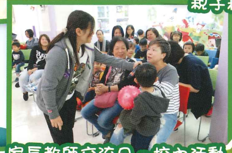
家長教師交流日 - 校內活動