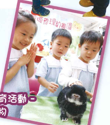
生命教育活動 - 我的寵物