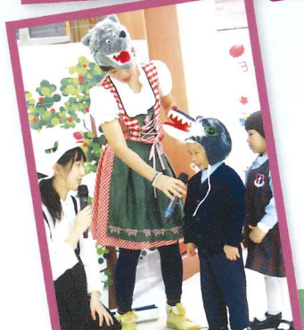
生命教育劇場 - 三隻小豬