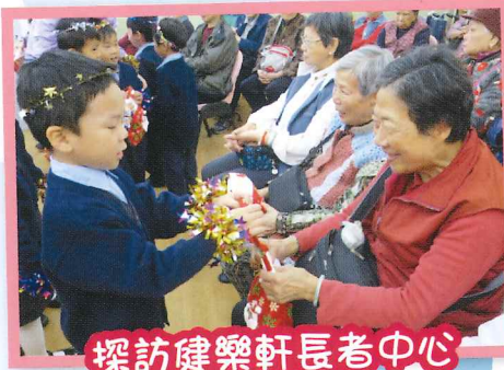
探訪健樂軒長者中心